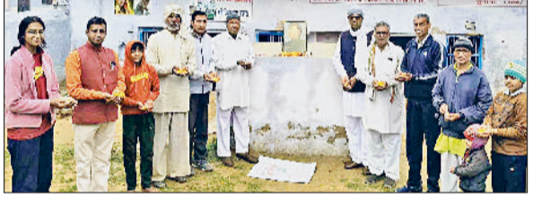
महेन्द्रगढ़। नेताजी के चित्र पर पुष्पार्पित करते हुए।