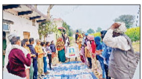
मंडी अटेली। चंदपुरा में सुभाष चंद्र बोस जयंती पर पुष्प अर्पित करते हुए।