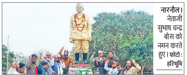
नारनौल। नेताजी सुभाष चंद्र बोस को नमन करते हुए।