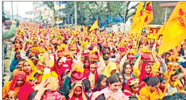
नारनौल। कलशयात्रा में शामिल महिलाएं व यात्रा में शामिल हाथी।

शोभायात्रा के अंतिम पड़ाव जोराली पहुंचने पर श्रद्धालुओं की जगतगुरु स्वामी रामभद्राचार्य का भी आशीर्वाद प्राप्त हुआ।