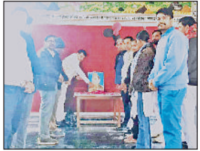
महेन्द्रगढ़। नेताजी के चित्र पर पुष्पार्पित करते हुए।