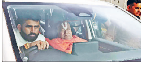
नारनौल। शोभायात्रा में शामिल गाड़ी में सवार जगतगुरु रामभद्राचार्य।

दक्षिणी हरियाणा की अब तक की सबसे बड़ी कलश यात्रा में 1100 महिलाओं ने रिस पर कलश धारण कर भाग लिया। पारंपरिक वेशभूषा में सजी महिलाओं का हुजूम शहर में हड़्डा स्थित चमत्कारी बालाजी मंदिर से श्रीश्याम मंदिर जोराली मंदिर तक करीब 10 किलोमीटर तक पैदल चला जो कि देखने लायक था। वहीं सैकड़ों की संख्या में पुरुषों ने निशान हाथ में लिया हुआ था। श्रद्धालुओं की संख्या और अनुशासन ने आयोजन को ऐतिहासिक बना दिया।