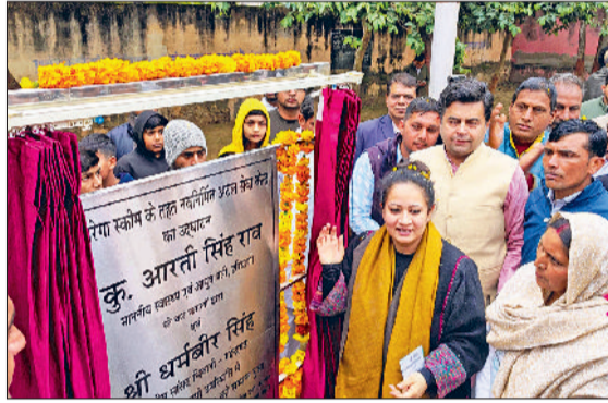
मंडी अटेली। दौंगड़ा अहीर में परियोजनाओं का उद्घाटन करती स्वास्थ्य मंत्री व कार्यक्रम में उपस्थित महिलाएं व अन्य।

उन्होंने कहा कि मैं आप सभी ग्रामीणों का आज यहां धन्यवाद करने आई है। वर्ष 2024 में दो चुनाव हुए थे। शुरुआत में आपने तीसरी बार नरेंद्र मोदी को भारत का प्रधानमंत्री बनाया। उसका भी बहुत धन्यवाद। उसके बाद आई विधानसभा की बात। पूरे हरियाणा में एक आवाज चल रही थी कि कौन बनाएगा हरियाणा में सरकार। क्योंकि आज तक हरियाणा में तीसरी बार सरकार किसी भी पार्टी ने नहीं बनाई। दौंगड़ा अहीर में स्वास्थ्य मंत्री आरती सिंह राव ने बताया कि वह पूरी कोशिश कर रही हैं कि दौंगड़ा अहीर को एक नर्सिंग कॉलेज दें। वहीं जनस्वास्थ्य विभाग की पाइपलाइन पांच सौ मीटर कम रह