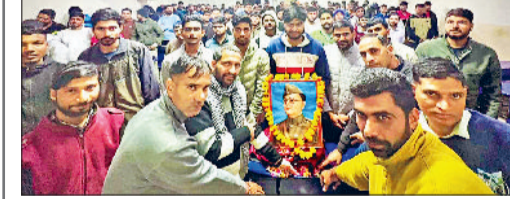
महेन्द्रगढ़। नेता जी के चित्र पर पुष्पार्पित करते हुए।