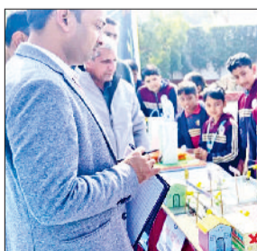
श्रीकृष्ण स्कूल गुंगारका में विज्ञान प्रदर्शनी आयोजित