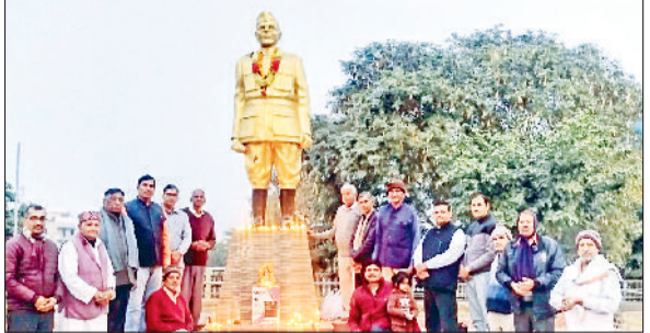
नारनौल। नेताजी सुभाष को नमन करते हुए।