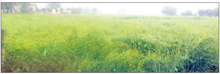
नारनौल। बारिश के दौरान खेत में लहलहाती सरसों की फसल।

वीरवार को को एक मध्यम श्रेणी का सशक्त पश्चिमी विक्षोभ उत्तरी पर्वतीय क्षेत्रों पर सक्रिय होने से उत्तरी पर्वतीय इलाकों में भारी बर्फबारी देखने को मिली। वहीं मैदानी राज्यों विशेषकर हरियाणा एनसीआर दिल्ली के साथ जिला महेंद्रगढ़ में अलसुबह से हल्की