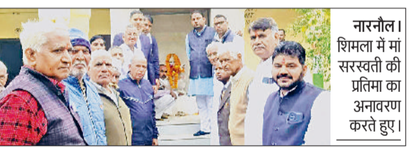
नारनौल। शिमला में मां सरस्वती की प्रतिमा का अनावरण करते हुए।