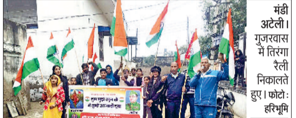
मंडी अटेली। गुजरवास में तिरंगा रैली निकालते हुए।