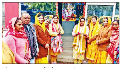
महेन्द्रगढ़। मां सरस्वती की पूजा करते हुए।